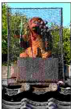
鬼門除けのお猿さん

☆天台五門跡のひとつに数えられる名刹《曼殊院門跡》 (お庭・書・襷絵・昔の厨房・・・見どころいっぱいです)