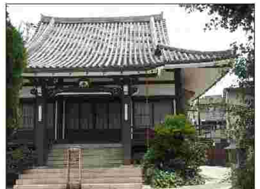
住吉の古刹 一運寺